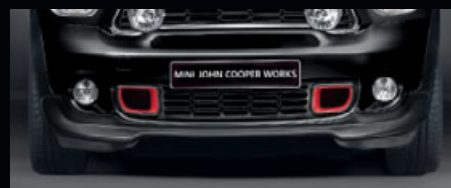
フロント・エプロン

モータースポーツの世界から生まれたジョン・クーパー・ワークスは、そのパワフルな外観と魅力的なデザインで、スポーティンク・ヘリテージを映し出します。フロント・エプロン、サイド・スカートおよびリア・スカートから構成される、モータースポーツ・スタイルのエアロ・ダイナミック・パッケージや黒い光沢を放つカーボン製のミラー・カバーがあなたのMINI CROSSOVER / MINI PACEMANのパフォーマンスと個性を一層引き立たせます。