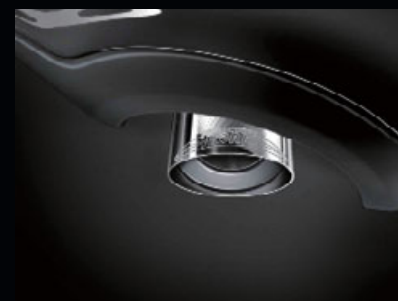
JCWエアロ・ダイナミック・パッケージ 非装備車用

サイド・スカットル、サイド・スカットル・サイド・トリムホワイト・ターン・シグナル・ライト (バルブ付き) のセット。