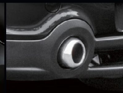
JCWエアロ・ダイナミック・パッケージ 装備車用 ※JCWエアロ・ダイナミック・パッケージの マフラー・カッターをそのまま使用します。