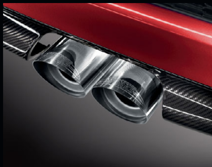
インパクトのあるスポーティなツイン・テール・パイプ・トリム ※写真は実際のデザインと異なる場合があります。