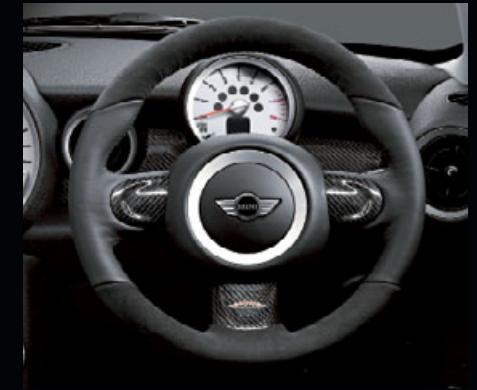
JCWレザー/アルカンタラ・ステアリング・ホイール マルチファンクション・スイッチ非装備車 装着例