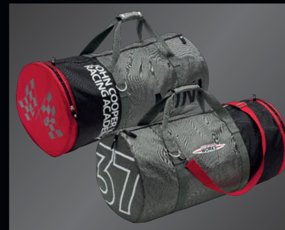
JOHN COOPER WORKS 37 バッグ [8022 2294 787] ¥9,612 (¥8,900)

胸元にプリント&刺繍のワッペン、右袖にJCWロゴのプリント、襟裏にグレー&レッドのボンネット・ストライプのプリント。 裾の内側にレッドのフラット・ロック・シーム、レッド&グレーのJCWネック・テープ。 コットン・ビケ100%