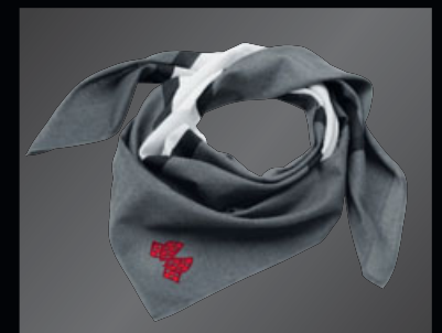
JOHN COOPER WORKS 37 スカーフ

ユニセックス [8016 2294 788] ¥2,700 (¥2,500) ヘビー・ウォッシュ加工、フロント・パネルとつばは2層構造。 左側に"JOHN COOPER WORKS"の刺繍、右側に"JCW RACING ACADEMY"のプリント、バックに"EXTREME RACING"の刺繍。 サイズ: 約58cm 素材: コットン100%、TPEの裏打ち コットン・ツイル(起毛処理)