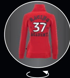
JOHN COOPER WORKS レーシング・アカデミー・スウェット・ジャケット 各¥11,016 (¥10,200)

メンズ S [8014 2294 762] M [8014 2294 763] L [8014 2294 764] XL [8014 2294 765] XXL [8014 2294 766]