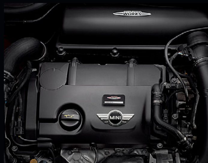
忘れられないドライビング感覚を提供するパワー・ソース

※オーバーブースト機能：フルスロットル時に一時的に過給圧を上昇させ、トルクをさらに押し上げます。