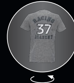
JOHN COOPER WORKS レーシング・アカデミーTシャツ 各¥4,104 (¥3,800)

メンズ S [8014 2294 772] M [8014 2294 773] L [8014 2294 774] XL [8014 2294 775] XXL [8014 2294 776]