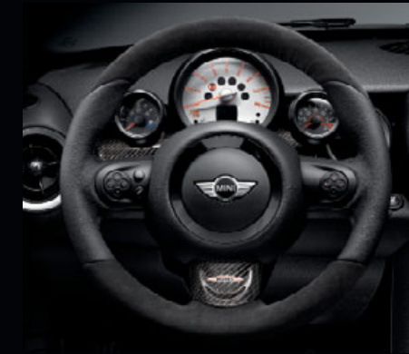
JCWレザー/アルカンタラ・ステアリング・ホイール マルチファンクション・スイッチ装備車 装着例