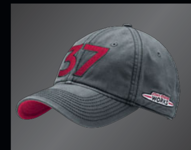
JOHN COOPER WORKS レーシング・アカデミー・キャップ

外側に2つのジッパー、2層構造でデニム・ポケット・リベット付きグリップ・ハンドルは2層構造、補強用カバー付き 外側のポケットにレーシング・フラッグのプリント "JOHN COOPER WORKS RACING ACADEMY" "37" "MINIワードマーク" "JOHN COOPER WORKS ロゴ"のプリント サイズ: 約73×35×35cm 素材: ナイロン、TPE の裏打ち 重さ: 1.25kg