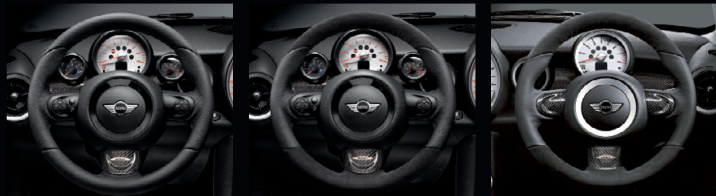
JCWレザー・ステアリング・ホイール マルチファンクション・スイッチ装着例