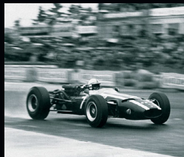
成功への道はここから。 Cooperフォーミュラ・レーシング・カー。