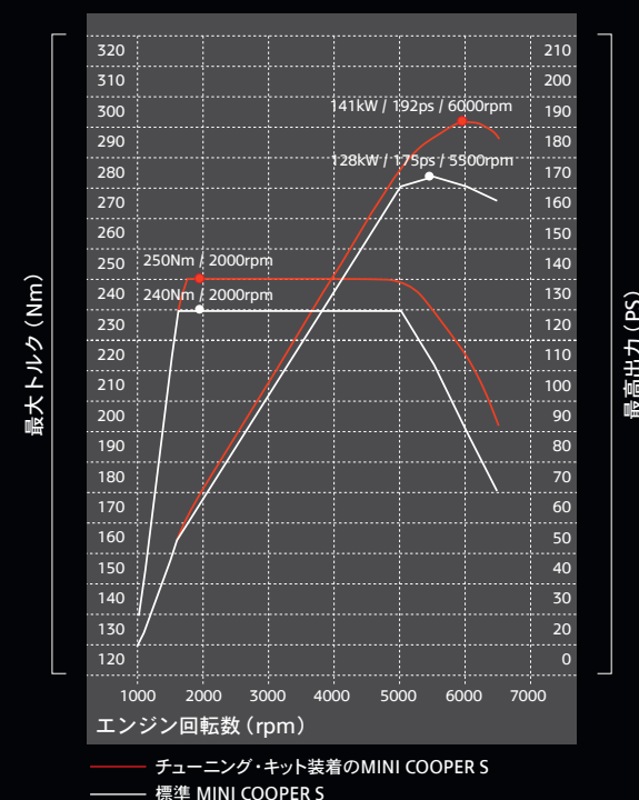
ジョン・クーパー・ワークスでチューニングされたMINI COOPER S性能データ (ヨーロッパ仕様における参考データです)

JCWチューニング・キットを装着する際に、前回のスパーク・プラグ交換後10000km以上走行している場合、チューニング・キットの取り付けに加えて、スパーク・プラグの交換が必要となります。また、チューニング・キット装着後は、オイル交換の際にスパーク・プラグの交換が毎回必要となります。詳細につきましては、最寄りのMINI正規ディーラーまでお問い合わせください。