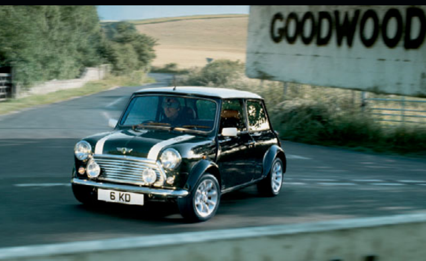
小型車である、されど大きな楽しみがそこにはある。 高速でコーナリングする初代Mini Cooper。