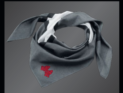
JOHN COOPER WORKS 37 スカーフ

ヘビー・ウォッシュ加工、フロント・パネルとつばは2層構造。左側に"JOHN COOPER WORKS"の刺繍、右側に"JCW RACING ACADEMY"のプリント、バックに"EXTREME RACING"の刺繍。 サイズ:約58cm 素材:コットン100%、TPEの裏打ち コットン・ツイル(起毛処理)