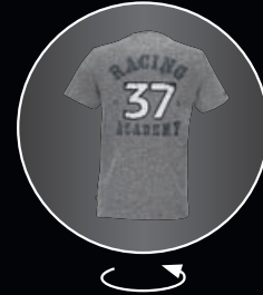
JOHN COOPER WORKS レーシング・アカデミーTシャツ 各¥3,990 (¥3,800)

メンズ S [8014 2294 772] M [8014 2294 773] L [8014 2294 774] XL [8014 2294 775] XXL [8014 2294 776]