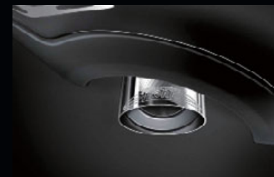
JCWエアロ・ダイナミック・パッケージ 非装備車用