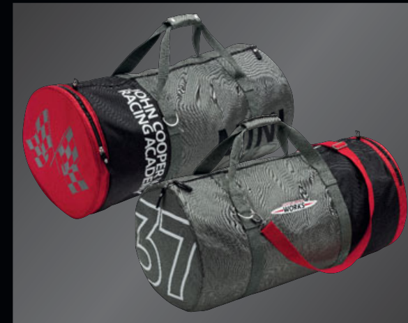
JOHN COOPER WORKS 37 バッグ

胸元にプリント&刺繍のワッペン、右袖にJCWロゴのプリント、襟裏にグレー&レッドのボンネット・ストライプのプリント。裾の内側にレッドのフラット・ロック・シーム、レッド&グレーのJCWネック・テープ。コットン・ビケ100%