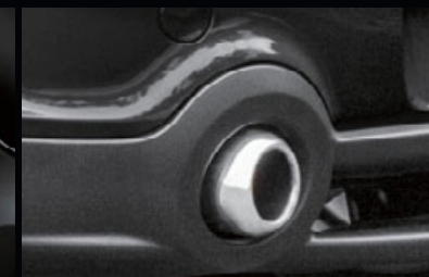
JCWエアロ・ダイナミック・パッケージ 装備車用

※JCWエアロ・ダイナミック・パッケージの マフラー・カッターをそのまま使用します。