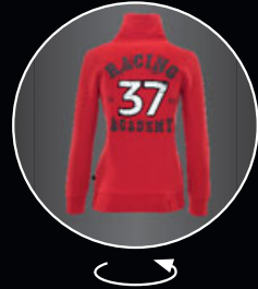
JOHN COOPER WORKS レーシング・アカデミー・スウェット・ジャケット 各¥10,710 (¥10,200)

メンズ S [8014 2294 762] M [8014 2294 763] L [8014 2294 764] XL [8014 2294 765] XXL [8014 2294 766]