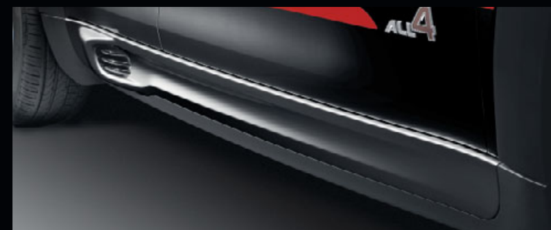
サイド・スカート