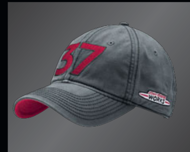
JOHN COOPER WORKS レーシング・アカデミー・キャップ

外側に2つのジッパー、2層構造でデニム・ポケット・リベット付きグリップ・ハンドルは2層構造、補強用カバー付き 外側のポケットにレーシング・フラッグのプリント "JOHN COOPER WORKS RACING ACADEMY" "37" "MINIワードマーク" "JOHN COOPER WORKS ロゴ"のプリント サイズ:約73×35×35cm 素材:ナイロン、TPEの裏打ち 重さ:1.25kg