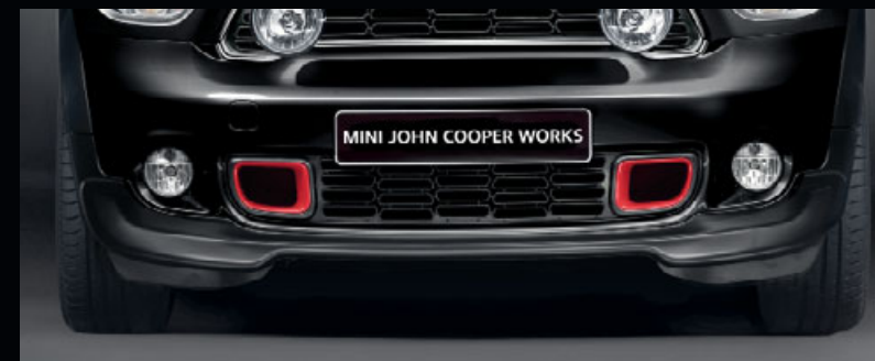
フロント・エプロン