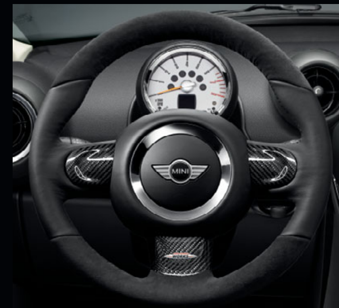
JCWレザー・ステアリング・ホイール マルチファンクション・スイッチ非装備車 装着例