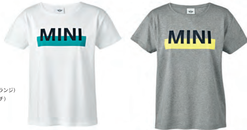
フロントにブラックのMINIワードマークの 立体的なラバー・プリント アクア・カラーのブロック・プリント

素材:ホワイト/アクア コットン100%(シングル・ジャージ) グレー/レモン コットン100%(シングル・ジャージ、メランジ) ややゆったりとしたシルエットのTシャツ(袖口にダブル・ステッチ) 広めの丸首 ネック・ラインには共布を使用、シングル・ステッチ 後身頃の裾はラウンド・ヘム(ダブル・ステッチ) 内側のバック・ネック・テープは同系色のシングル・ジャージ MINIロゴ・タグ付き ¥4,860(¥4,500)