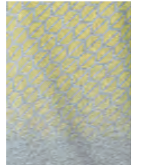
フロントにレモン・カラーの グラデーションのシグネット(印章) パターン・プリント