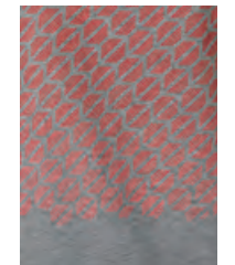
フロントにコーラル・カラーの グラデーションのシグネット (印章) パターン・プリント