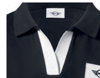
ボタン・レスでオープンな襟元には、 ホワイトの前立て