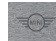
左裾にグレーの MINIロゴ・ラバー・プリント