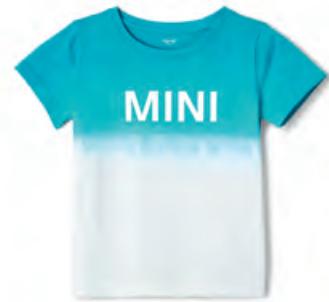
アクア・カラーのディップ・ダイ(浸染)を施したデザイン