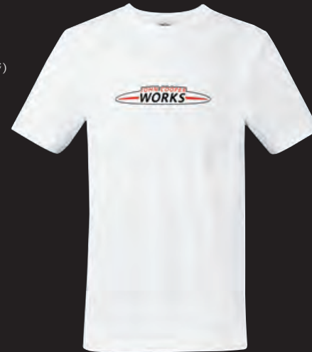
フロントにJOHN COOPER WORKSロゴのラバー・プリント ロゴの白地部分はホワイト・ラバー・プリント