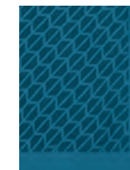
フロントにブラックのシグネット (印章) パターン・プリント