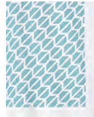
フロントにアクア・カラーの シグネット (印章) パターン・プリント