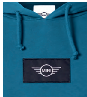
フロントのブラック・ワッペンに ホワイトのMINIロゴ刺繍