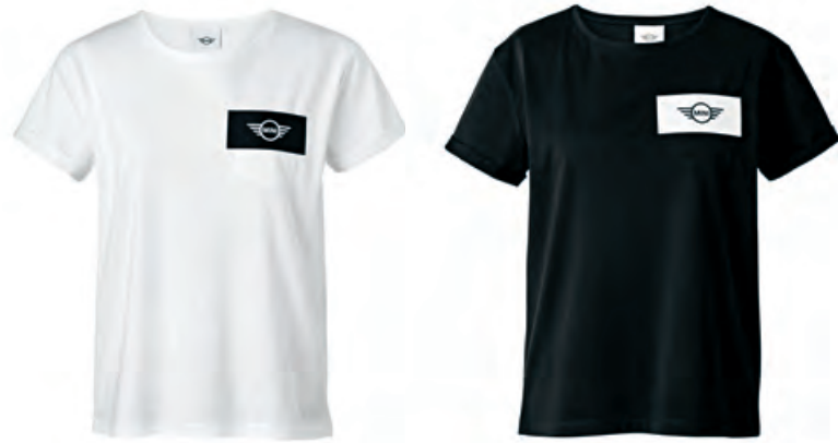
左胸のポケットの上にはブラック・ブロックに カットアウトのMINIロゴ(マット転写プリント)