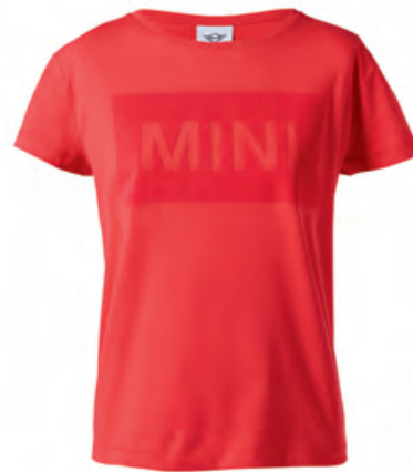
フロントに同系色のジャージにカットアウトの MINIワードマーク

素材:コットン 100% (シングル・ジャージ) セミ・ルーズ・フィット、ドロップ・ショルダーのTシャツ 広めのラウンド・ネック 後身頃の裾はラウンド・ヘム MINIロゴ・タグ付き ¥4,946 (¥4,580)