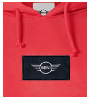
フロントのブラック・ワッペンに ホワイトのMINIロゴ刺繍