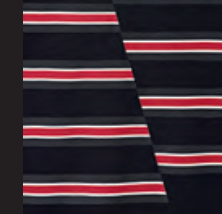
切り替えが特徴的なボーダー (ブラック/ホワイト/チリ・レッド) のラバー・プリント 左裾にエンボス加工されたブラックのラバー製 JOHN COOPER WORKSロゴ