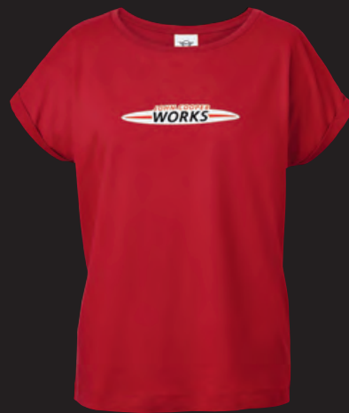
フロントにJOHN COOPER WORKSロゴのラバー・プリント ロゴの白地部分はホワイト・ラバー・プリント