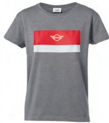
フロントにコーラルとホワイトのカラー・ブロック、 ホワイトのMINIロゴ・プリント