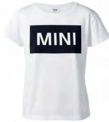
フロントにブラックのジャージにカットアウトの ホワイトのMINIワードマーク