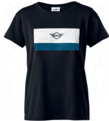
フロントにホワイトとアイランドのカラー・ブロック、 ブラックのMINIロゴ・プリント