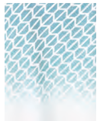
フロントにアクア・カラーの グラデーションのシグネット(印章) パターン・プリント