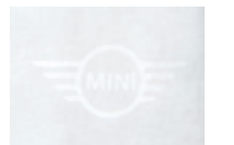
左裾にホワイトの MINIロゴ・ラバー・プリント