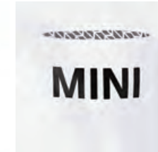
左胸のシーム・ポケットには MINIワードマーク (ブラックのラバー・プリント) ポケット内側には、コントラストが鮮やかな シグネット (印章) パターン・プリント (ブラック)