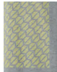
フロントにレモン・カラーの シグネット (印章) パターン・プリント