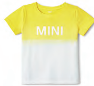
レモン・カラーのディップ・ダイ(浸染)を施したデザイン