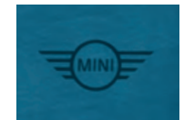
左裾にブラックの MINIロゴ・ラバー・プリント