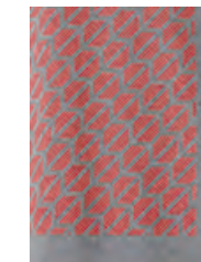
フロントにコーラル・カラーのシグネット (印章) パターン・プリント