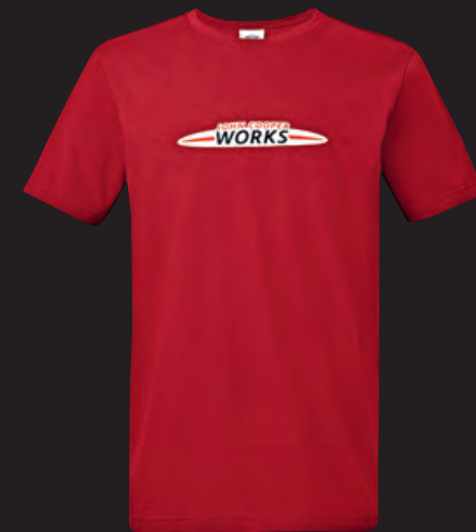
フロントにJOHN COOPER WORKSロゴのラバー・プリント ロゴの白地部分はホワイト・ラバー・プリント