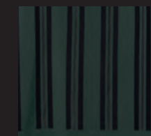
ブラックのストライプ・プリント、センターのブラック・ボーダーのみラバー・プリント 左裾にエンボス加工されたブラックのラバー製 JOHN COOPER WORKSロゴ