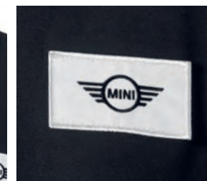
左胸のホワイト・ワッペンにブラックの MINIロゴ刺繍