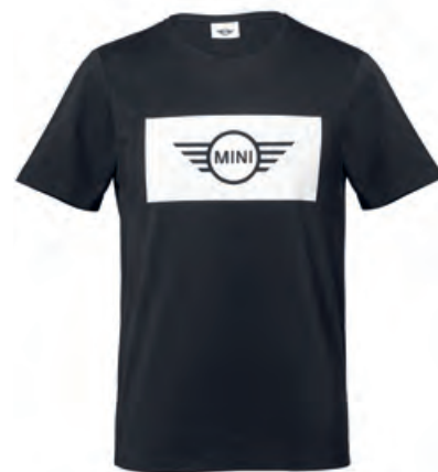
フロントにホワイトのジャージに カットアウトのブラックのMINIロゴ

素材:コットン100% (シングル・ジャージ) クラシック・フィットのTシャツ 裾はストレート MINI ロゴ・タグ付き ¥4,946 (¥4,580)