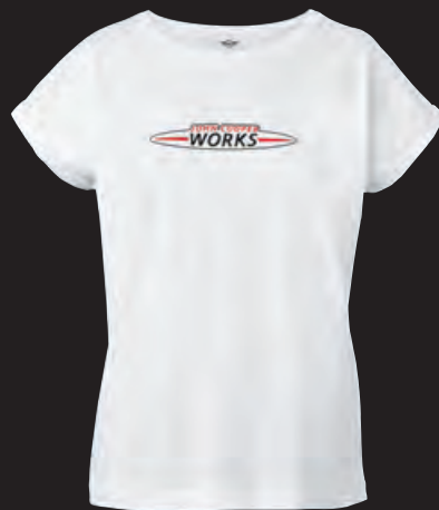
フロントにJOHN COOPER WORKSロゴのラバー・プリント ロゴの白地部分はホワイト・ラバー・プリント

素材:コットン100% (シングル・ジャージ) ゆったりとしたシルエットのTシャツ 切替なしのフレンチ・スリーブ (袖口は折り返し) ややボートネック・スタイルの丸首 ネック・ラインには共布を使用、シングル・ステッチ 後身頃の裾はラウンド・ヘム (ダブル・ステッチ) MINIロゴのタグ付き