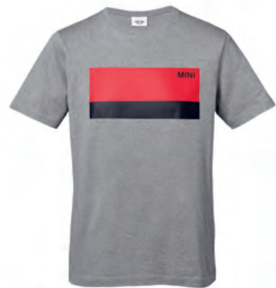
フロントにコーラルとブラックのカラー・ブロック、 ブラックのMINIワードマーク・プリント