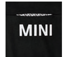
左胸のシーム・ポケットには MINIワードマーク (ホワイトのラバー・プリント) ポケット内側には、コントラストが鮮やかな シグネット (印章) パターン・プリント (白地にブラック)