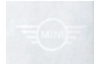
左裾にホワイトの MINIロゴ・ラバー・プリント