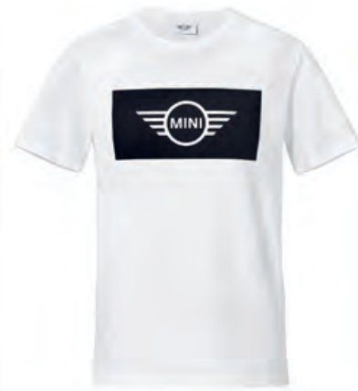
フロントにブラックのジャージに カットアウトのホワイトのMINIロゴ