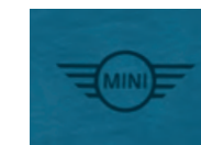
左裾にブラックの MINIロゴ・ラバー・プリント