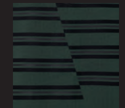
切り替えが特徴的なブラックのボーダー・プリント、センターのブラック・ボーダーのみラバー・プリント 左裾にエンボス加工されたブラックのラバー製 JOHN COOPER WORKSロゴ