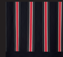
ストライプ (ブラック/ホワイト/チリ・レッド) のラバー・プリント 左裾にエンボス加工されたブラックのラバー製 JOHN COOPER WORKSロゴ