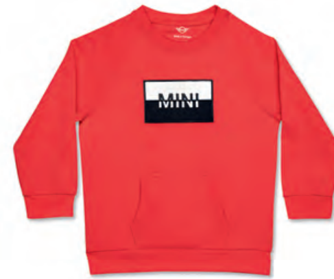
フロントにブラックとホワイトの ワッペンにMINIロゴ刺繍