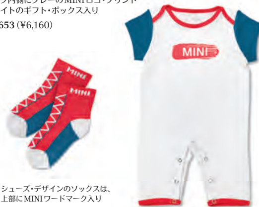
シューズ・デザインのソックスは、 上部にMINIワードマーク入り

ホワイト/アイランド/コーラル 8014 2460 848 サイズ: 6~9か月 素材: プレブスーツ/コットン100% (ソフト・ジャージ) ソックス/コットン80%、ポリアミド18%、ポリウレタン2% 柔らかな軽量ジャージ製カバーオールとソックスのセット アイランドの袖とコーラルのバイヤス・テープがアクセント ラウンド・ネックの肩部分は二重仕様 カバーオールの股下はスナップ・ボタンで開閉 ネック内側にグレーのMINIロゴ・プリント ホワイトのギフト・ボックス入り ¥6,653 (¥6,160)