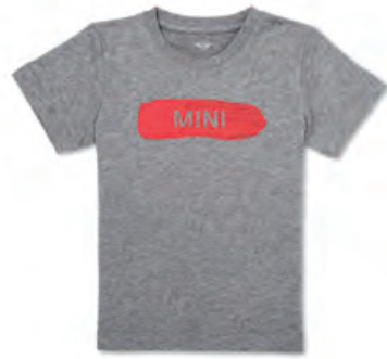
フロントにコーラル・カラーの ブラシ・ストローク・デザインに、 MINIワードマークがカットアウト されたラバー・プリント