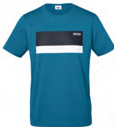
フロントにブラックとホワイトのカラー・ブロック、 ホワイトのMINIワードマーク・プリント