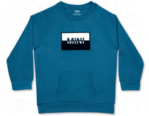
フロントにブラックとホワイトの ワッペンにMINIロゴ刺繍