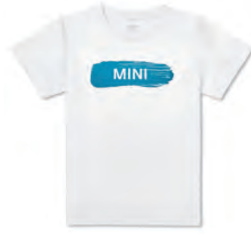
フロントにアイランド・カラーの ブラシ・ストローク・デザインに、 MINIワードマークがカットアウト されたラバー・プリント