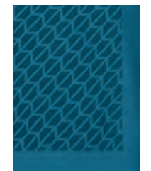
フロントにアイランド・カラーの グラデーションのシグネット (印章) パターン・プリント