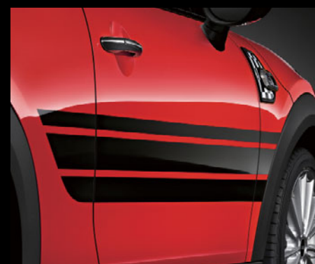
ジェット・ブラック装着例

John Cooper Works Pro ルーフ・ステッカー ※ 電動ガラス・サンルーフ非装備車のみ装着可能です。 ※ ブラック・ルーフ専用 MINI 3 DOOR用 [5114 2354 990] ¥24,624 (¥22,800) 取付作業参考時間: 約 60分 MINI 5 DOOR用 [5114 2359 446] ¥20,088 (¥18,600) 取付作業参考時間: 約 60分