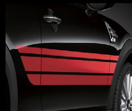
チリ・レッド装着例

John Cooper Works Pro サイド・ストライプ・セット MINI 3 DOOR用 各 ¥10,649 (¥9,860) [5114 2355 306] ジェット・ブラック [5114 2355 195] チリ・レッド MINI 5 DOOR用 各 ¥9,936 (¥9,200) [5114 2359 450] ジェット・ブラック [5114 2359 449] チリ・レッド 取付作業参考時間: 約 45分