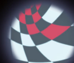
JOHN COOPER WORKS