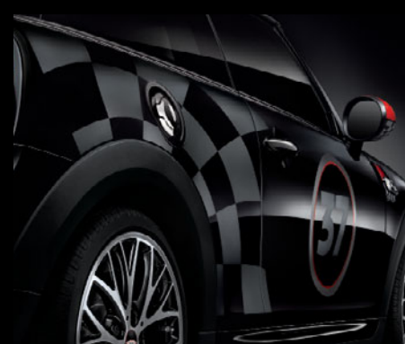
レーシング37(マット)装着例

John Cooper Works Pro サイド・ストライプ・セット MINI 3 DOOR用 各 ¥10,649 (¥9,860) [5114 2355 306] ジェット・ブラック [5114 2355 195] チリ・レッド MINI 5 DOOR用 各 ¥9,936 (¥9,200) [5114 2359 450] ジェット・ブラック [5114 2359 449] チリ・レッド 取付作業参考時間: 約 45分